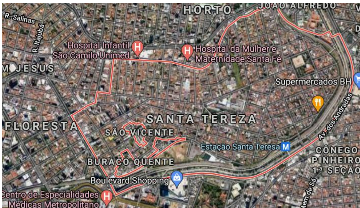
Bairro Santa Tereza