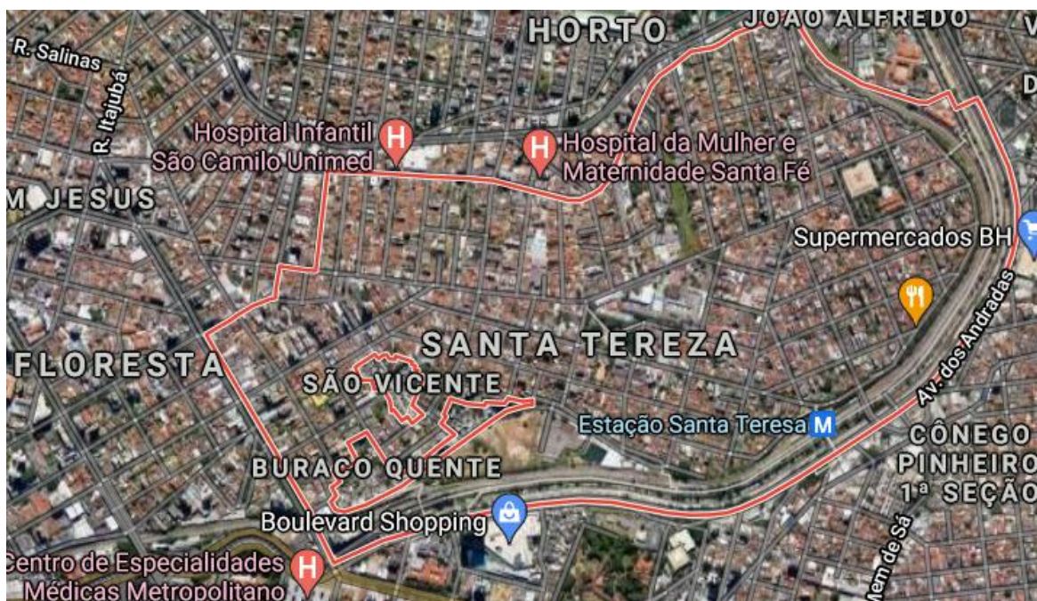
Bairro Santa Tereza