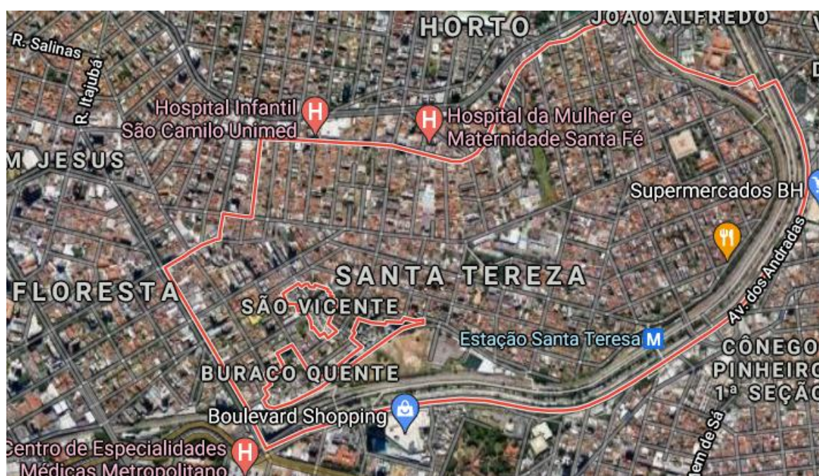
Bairro Santa Tereza