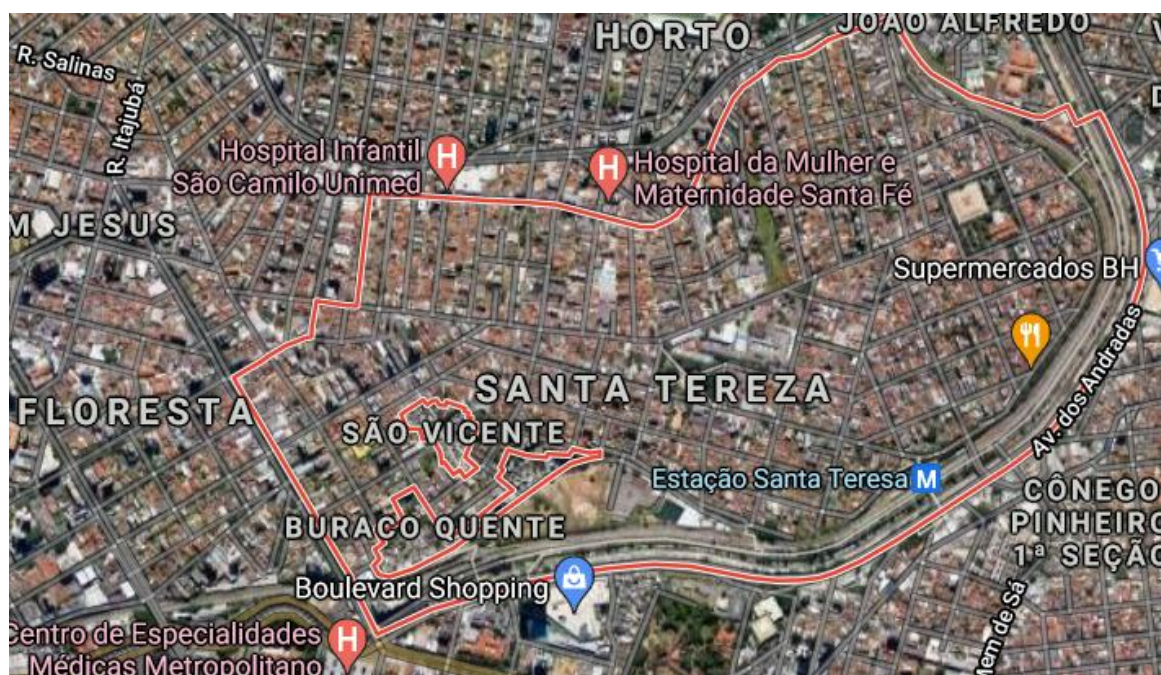
Bairro Santa Tereza